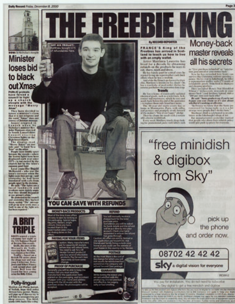
Apparition: The Freebie King, Daily Record, Glasgow, 8 December 2000 (p. 37), 2000 ingelijste omslag en bladzijde / framed cover and page ed. 7 / II A.P.