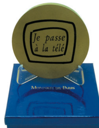
Je passe à la télé, 1996

The Bronx Museum, New York ; Musée du Quebec, Quebec ; Musée National d'Art Moderne, Centre Pompidou, Paris ; Kunst Werke, Berlin ; Musée d'art Contemporain, Lyon ; Kiasma, Helsinki; Santa Monica Museum, Los Angeles.