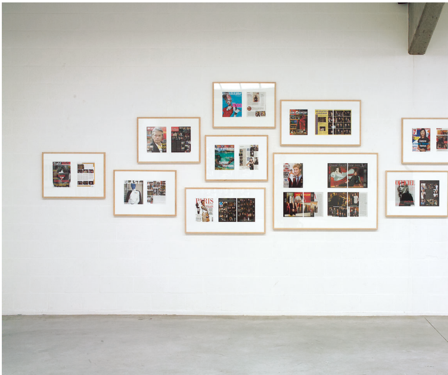
Apparition: Quand Ricard rime avec Art (Selection 2003-2004), 2004 ingelijste voorpagina's en bladzijden / framed covers and pages 11 delen / parts, unikaat / unique piece