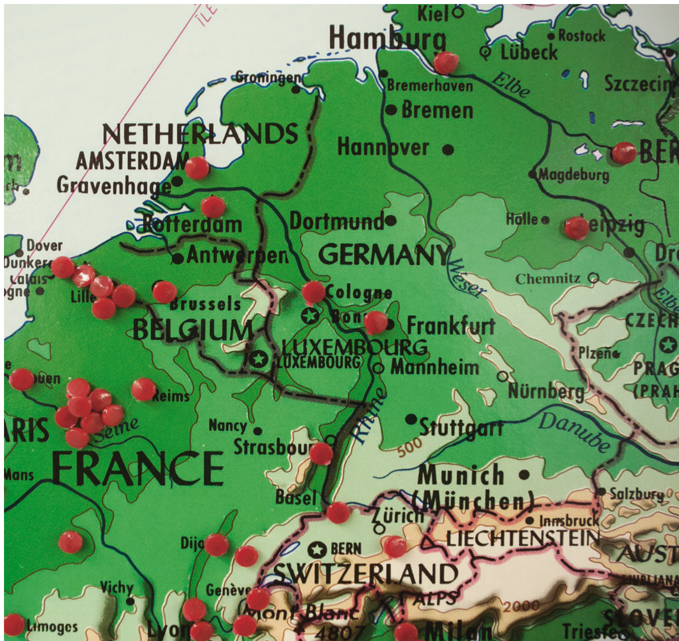
Untitled (World Map), 1993-2004, work in progress, detail Wereldkaart met rode merknaldjes op de steden waar de kunstenaar tot nu toe heeft geëxposeerd / Worldmap with red map pins placed in the cities where the artist already exhibited