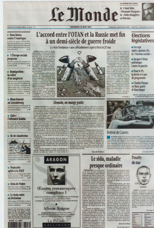
Apparition: Demain on mange gratis, Le Monde, Paris, 16 mai 1997 (p.1), 1997 ingelijste voorpagina / framed front page ed. 20 / V A.P.