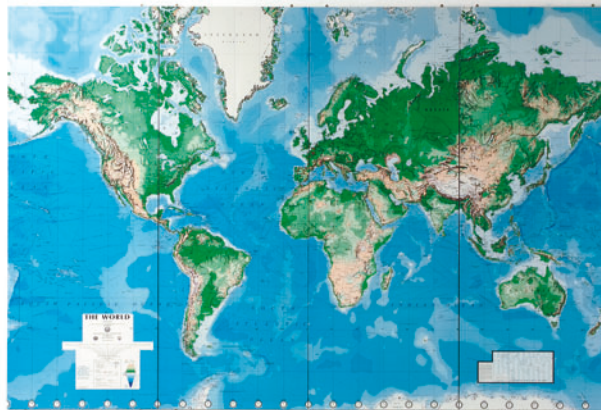
Untitled (World map), 1993-2004 , work in progress, 264 x 396 cm., unikaat / unique piece